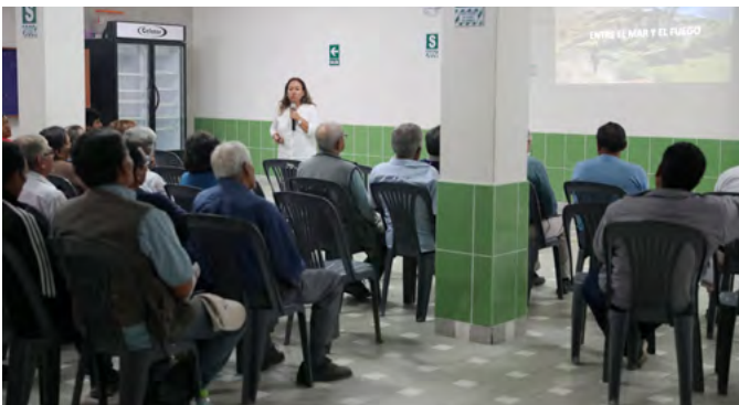
Reunión informativa Huancarqui