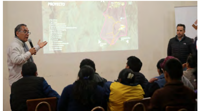
Reunión informativa Lluta