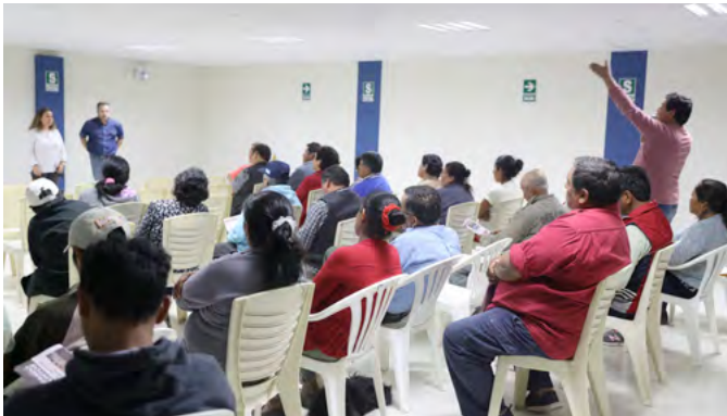
Reunión informativa anexo Pedregal

El objetivo de llevar a cabo cada mes dichas reuniones, es informar acerca de los avances del proyecto, y recoger observaciones, interrogantes y dudas en relación a las actividades que ejecutamos en el área de estudio de Zafranal. A las exposiciones de marzo, asistieron más de 200 personas, entre autoridades, dirigentes y pobladores en general.