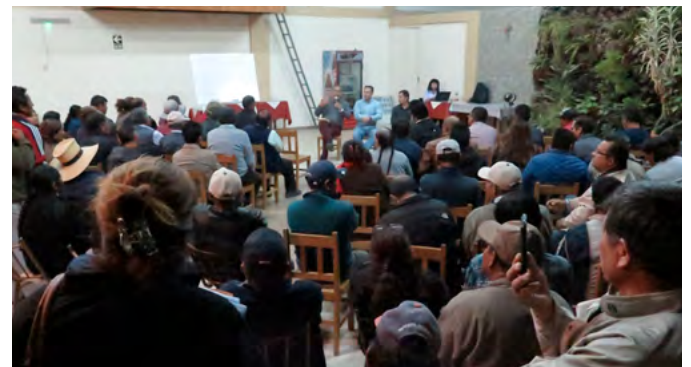
Reunión informativa Majes